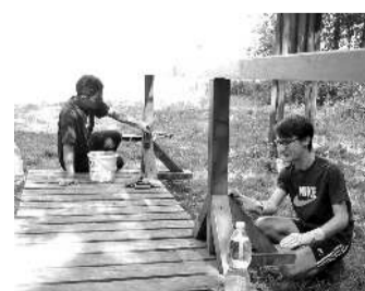
DOBROVOLNÍCI při práci ve Slavkovském lese.

Mezinárodní dobrovolnické projekty jako tento každoročně pořádá nezisková organizace INEXSDA, která v oblasti dobrovolnictví působí již od roku 1991. Mimo pořádání dobrovolnických pobytů na